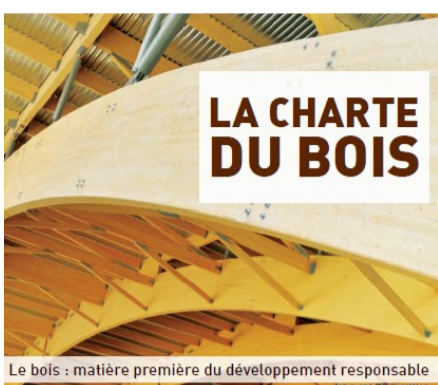
Le bois : matière première du développement responsable

Annoncée le 30 avril dernier, la Charte du bois constitue une excellente nouvelle pour l'industrie! Les principales mesures annoncées visent notamment l' évaluation systématique de l'utilisation du bois à l'étape d'avant-projet pour tous les projets financés en tout ou en partie par des fonds publics, l'élimination de la nécessité d'avoir recours à une solution de rechange pour la construction de bâtiments en bois de cinq ou six étages ainsi que la mise en place d'un plan de formation afin qu'ingénieurs et architectes acquièrent les connaissances les plus récentes sur l'utilisation de bois comme élément structural.